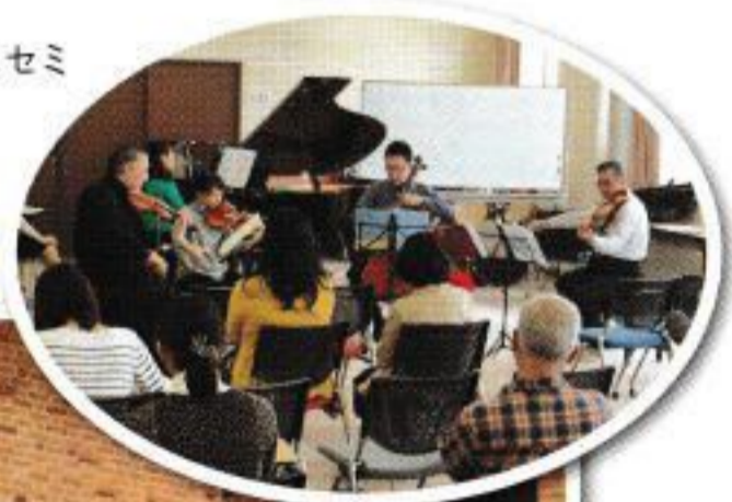
「室内楽コースセミナー」のよう

を吸収して、自分のものにしていくことだと思えます。子供のころから自由に音楽を想像し、それを操る自信を得ることで、どのような局面においても、この真の「インタープレイ」が不可欠です。世界中の人たちと喜怒哀楽を共有し、よりグローバルな「良き地球人」が増えることを心から祈っております。