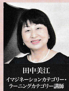
田中美江 イマジネーションカテゴリー・ ラーニングカテゴリー講師

北九州市出身。愛称「まろ」。1981年ウィーン市立音楽院に入学。翌年コンツェルト・ハウスでコンサート・デビューを飾る。1988年帰国後、群馬交響楽団、読売日本交響楽団のコンサートマスターを経て、1997年NHK交響楽団のコンサートマスターに就任。2000年より第1コンサートマスターとして活躍。2023年4月より2025年3月まで特別コンサートマスターを務めた。 演奏会やオーケストラの企画も自ら行い、2004年よりスタートした銀座・王子ホールとの共同企画『MAROワールド』では、指揮者無しの大規模室内楽「マロオケ(Meister Art Romantker Orchester)」をプロデュースし好評を得ている。これらの功績により、「2020年度 第33回 ミュージック・ペンクラブ音楽賞」にて『MAROワールド』がクラシック室内楽・合唱部門賞を受賞。1979年史上最年少で北九州市民文化賞、2001年福岡県文化賞、2014年第34回NHK交響楽団「有馬賞」受賞。北九州文化大使、昭和音楽大学特任教授、昭和音楽大学附属ストリングスアカデミー主任教授、桐朋学園大学非常勤講師、WHO国際医学アカデミー・ライフハーモニーサイエンス評議会議員。著書には『ルフトバウゼー・ウィーンの風に吹かれて』『篠崎史紀 ヴァイオリン選曲集 Maro's Palette』。篠崎史紀のヴァイオリン上達練習法「パンドラの箱」、『絶対! うまくなる バイオリン100のコツ』、『MAROの「偏愛」名曲案内 - フォースと共に!』がある。使用楽器は(株)ミュージック・プラザより貸与されている1727年製ストラディヴァリウス。